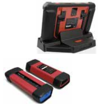
VCI smartbox 3